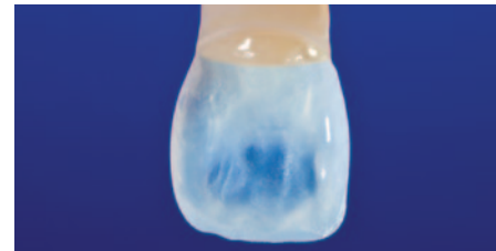
Aufbau der Palatinalfläche mit EcuSphere-Shine Transparent.