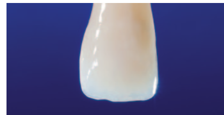
EcuSphere-Shine Transparent als labialer Schmelzersatz in naturgetreuer Schichttechnik.