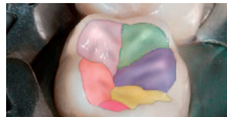
Planung der Rekonstruktion einer funktionalen Kaufläche, Schritt 2.