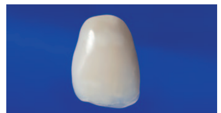
Individualisierung mit EcuSphere-Flow Opak-Weiß.