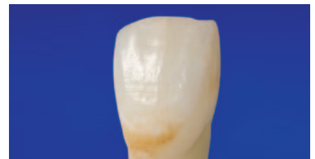
Ausgangssituation: Schmelzbegrenzte, tiefe und bräunliche Verfärbung.