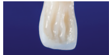
Mit EcuSphere-Shape D-A3 wird der Dentinkern ergänzt.