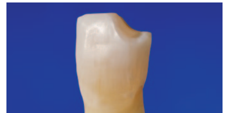
Rekonstruktion mit EcuSphere-Shine A2.