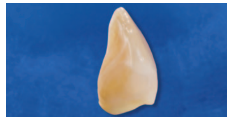
Rekonstruktion mit EcuSphere-Shape A3.