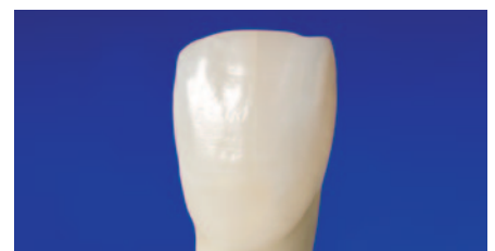
Endergebnis: Restauration Kavitätenklasse V mit EcuSphere-Shine Transparent.