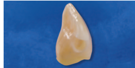
Ausgangssituation Kavitätenklasse III.