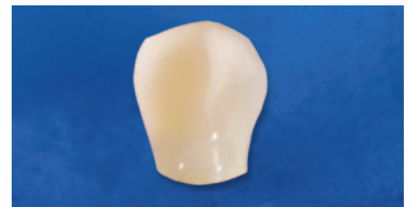
Rekonstruktion mit EcuSphere-Flow A3,5.