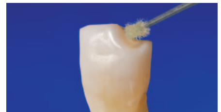
Bonden der geglätteten Frakturrränder.