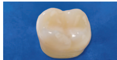
Rekonstruktion mit EcuSphere-Shape A3,5.