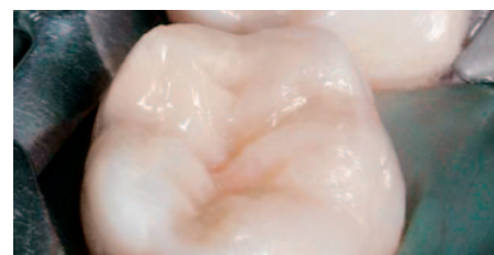
Endergebnis mit EcuSphere-Carat A3,5.