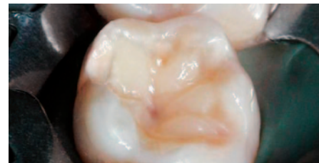
Erste Inkremente beim Aufbau der funktionalen Kaufläche.