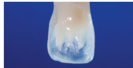
Modellierung des zervikalen Dentinkerns mit EcuSphere-Flow A4.