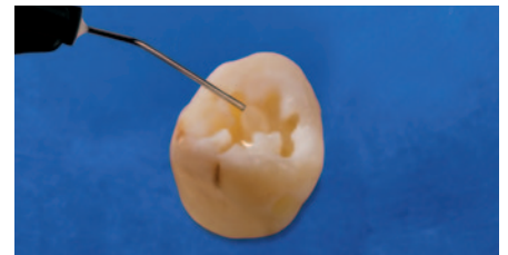
Minimalinvasive Präparation Kavitätenklasse I, Applikation von EcuSphere-Flow.