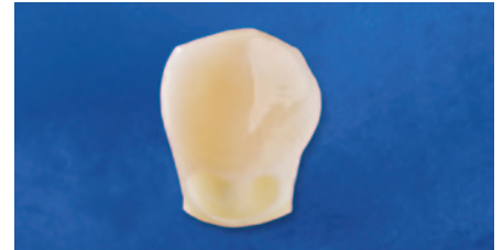
Ausgangssituation Kavitätenklasse V.